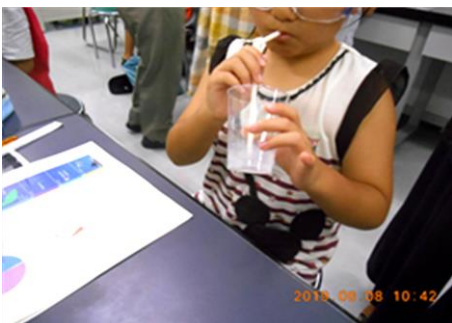
「見えない空気は何でできている？」