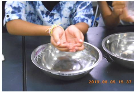
「つかめる水を作ろう」