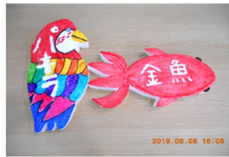
「発泡スチロールでオリジナル表札作り」