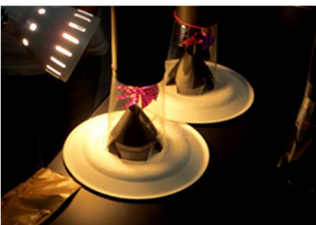
「太陽の光で回るソーラー風車を作ろう」

これらの教室は小学4～6年生が参加対象で、各教室20名の定員で開催し、参加者は子どもと保護者等を含め、全306名が実験や工作を体験しました。