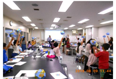
「環境地球儀を作ろう」