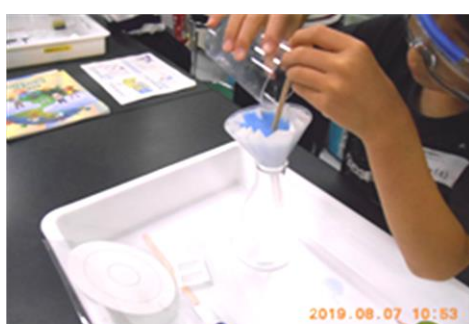
「汚れた水をきれいにしよう」