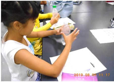
「人工の雲を作ろう」