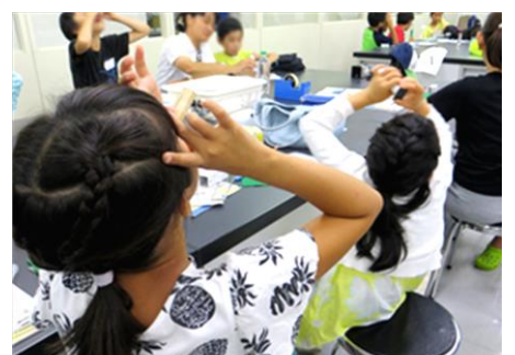
「手作り顕微鏡でミクロの世界をのぞいてみよう」