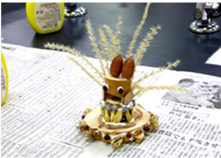
「森の木エクラフトで森を考えよう」