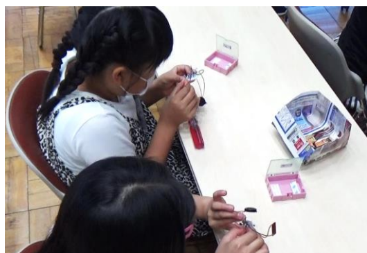
電子部品のオルゴールを組立て中