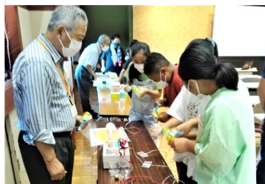
手回し発電機で40W電球の点灯実験