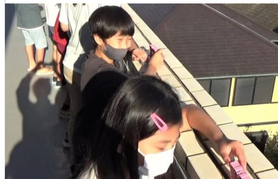
オルゴールをバルコニーでメロディ確認