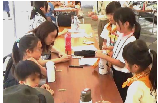
来館者に、子どもたち講師が遊び方を説明