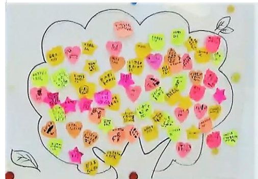
「環境の木」環境キーワードがいっぱい