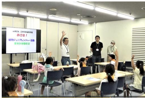
教室の説明、「今日は皆さんが講師だよ」