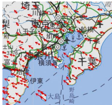
図-2 関東周辺の水平変動*2