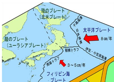
図-1 日本列島付近の地殻プレート*1

例えば、交通事故で死亡する統計確率は約0.2%とされ、誰もが交通事故には十分注意している。地震と交通事故を単純比較はできないが、「地震も身近な危険」、地震対策が重要であることは言うまでもない。