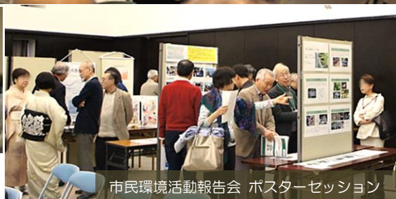
市民環境活動報告会 ポスターセッション