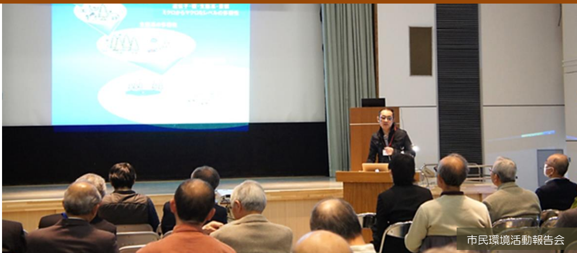
市民環境活動報告会