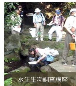
水生生物調査講座

神奈川県環境科学センターの環境学習リーダー養成講座や横浜市子ども科学館（はまぎん子ども宇宙科学館）などが開催している環境学習に、様々な環境体験教室を実施しています。