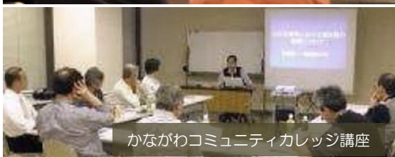
かながわコミュニティカレッジ講座