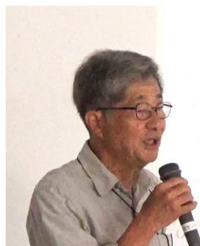
西 勝海・ウリ科植栽の育成