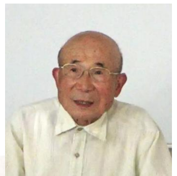
日下部雅省・環境活動の変遷